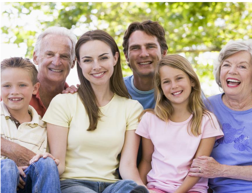
Implantate sind ab 18 Jahren bis in's hohe Alter möglich. Sie geben Sicherheit beim Reden und Lachen und sie ermöglichen es, wie mit eigenen Zähnen zu beißen und zu kauen.

Wenn die Nachbarzähne schon sehr stark gefüllt oder geschädigt sind, kann es besser sein, eine Brücke zu machen. Durch die Kronen werden die Zähne stabilisiert, so dass sie länger halten können.