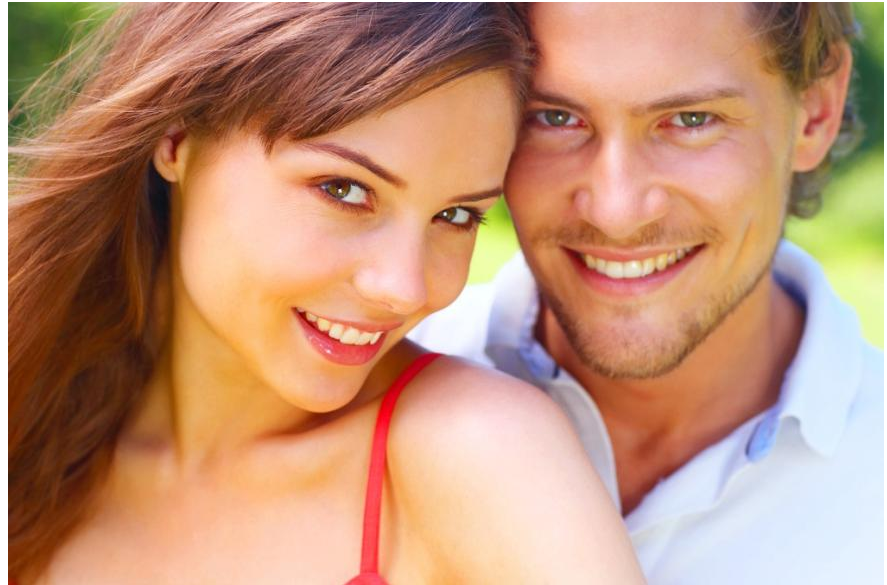
Lückenlos glücklich: Wer heute (z.B. durch einen Unfall) einen Zahn verliert, entscheidet sich meistens für ein Implantat mit Krone. Der Grund ist einfach: Kaum jemand möchte noch, dass gesunde Nachbarzähne für eine Brücke abgeschliffen werden.

Mit einer Zahnlücke kann man auch nicht mehr so gut kauen und abbeißen. Der Kieferknochen baut sich im Bereich der