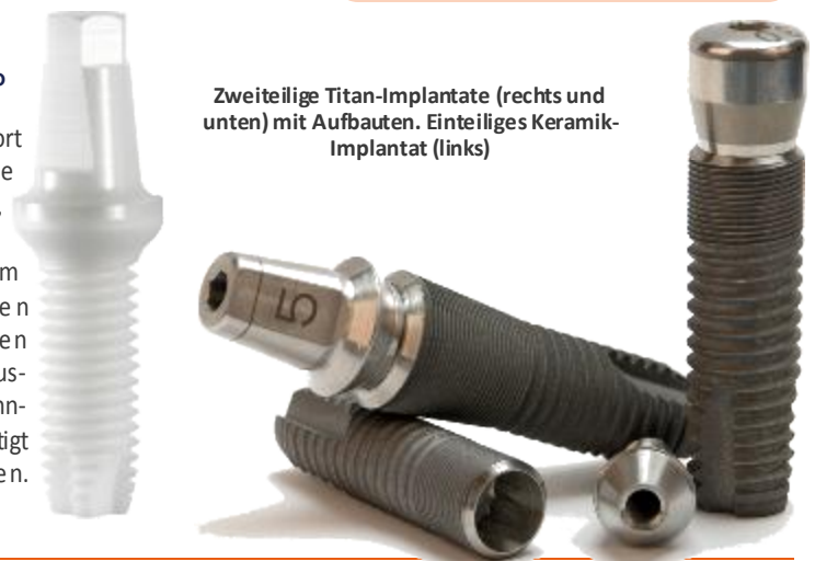
Zweiteilige Titan-Implantate (rechts und unten) mit Aufbauten. Einteiliges Keramik-Implantat (links)